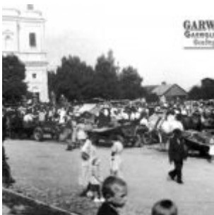
Rynek w Parysowie