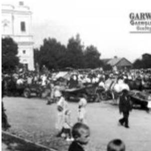
Rynek w Parysowie