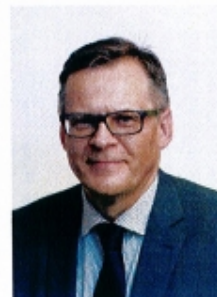
PREZES KASY ROLNICZEGO UBEZPIECZENIA SPOŁECZNEGO