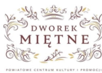
POWIATOWE CENTRUM KULTURY I PROMOCJI